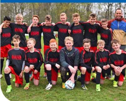
Hannover 96 Cup