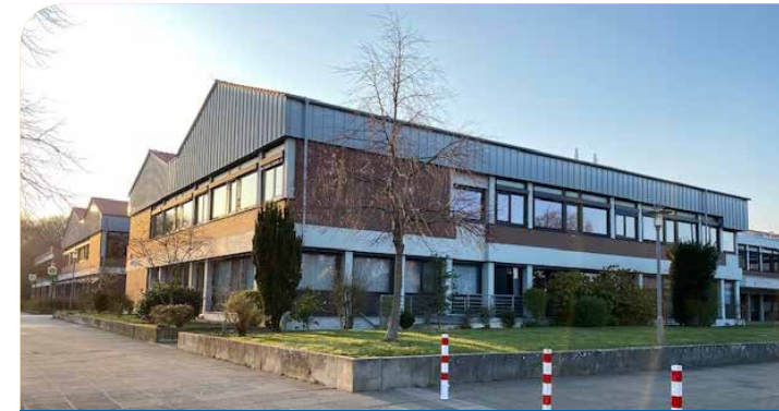
Oberschule mit Gymnasialzweig